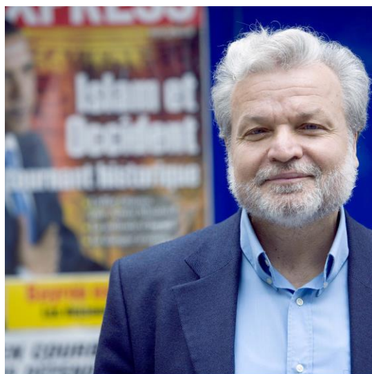
GÜRSEL Nedim